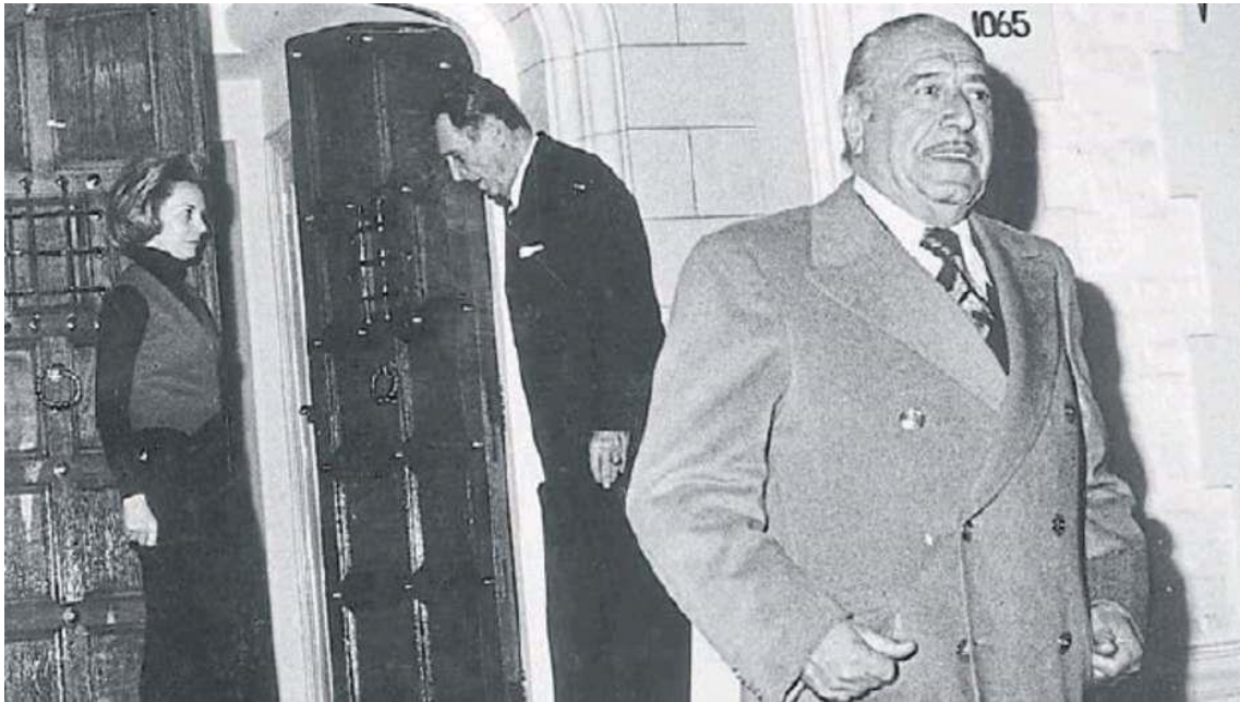
Peron, Isabel, Campora