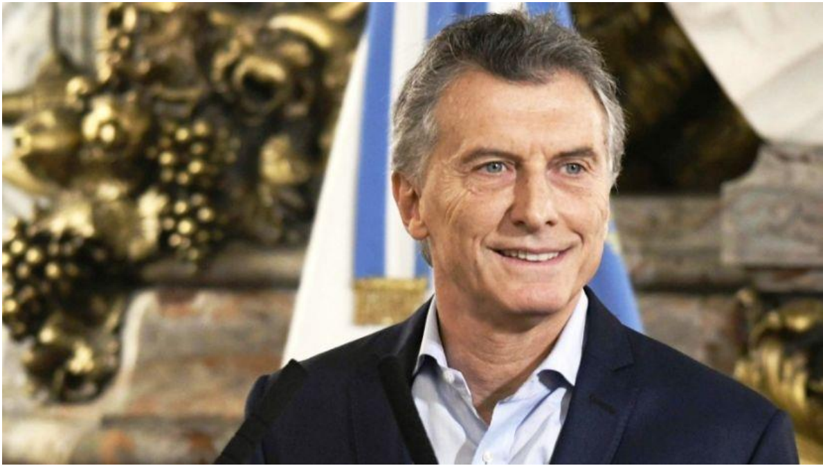
Presidente Mauricio Macri