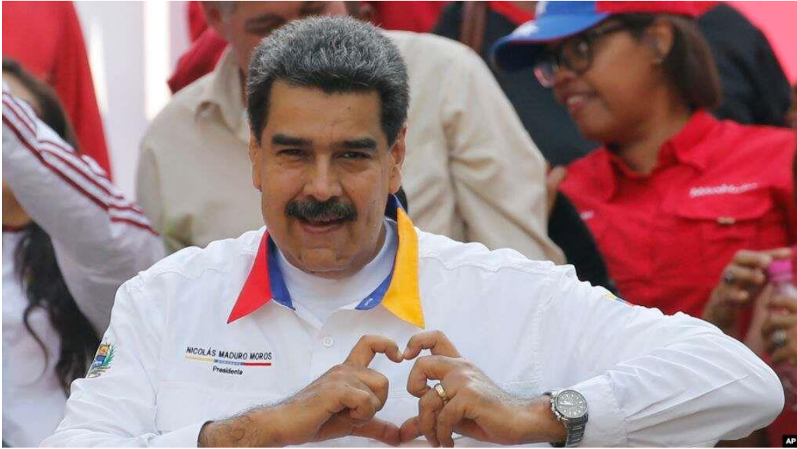
Nicolás Maduro, Presidente de Venezuela