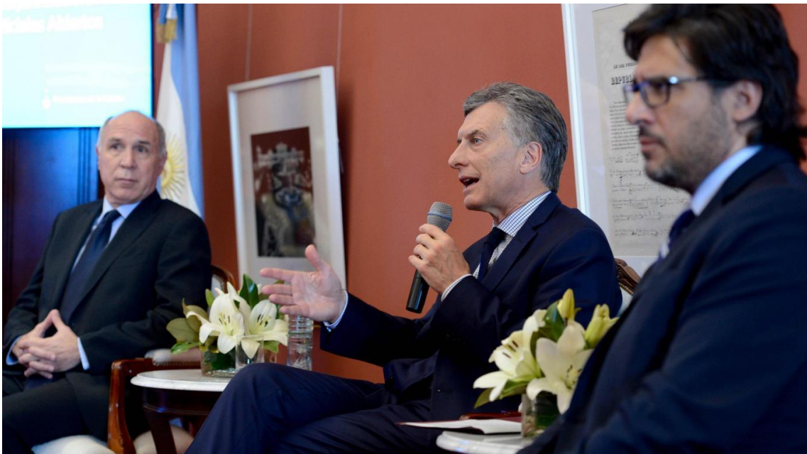
Ricardo Lorenzetti, miembro de la Corte Suprema, Mauricio Macri, Presidente de la Nación y Germán Garavano, Ministro de Justicia y Derechos Humanos